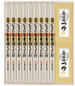
C262-704(RZ-50) ★ 寛文五年堂 いなにわ手絢うどん・比内地鶏つゆ詰合せ いなにわ手絢うどん100g×9、比内地鶏つゆ120ml×2