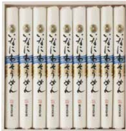
C262-705(SAK-30N) ★ 寛文五年堂 いなにわそうめん いなにわそうめん80g×9