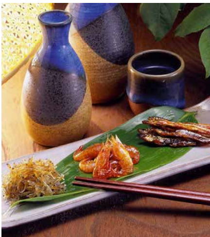
C245-701(M50) 安田のつくだ煮 詰合わせ いかあられ100g、わかさぎ80g、胡桃フィッシュ90g、 ちりめん80g、こえび90g、ごごり80g 各1 〔賞味期限:常温60日〕