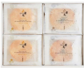
C221-707 米菓匠 金の鼎庵・銀の鼎庵 詰め合わせギフト 金の鼎庵、銀の鼎庵 各10枚入 〔賞味期限:常温180日〕