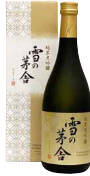
C241-713 雪の茅舎 純米大吟醸720ml 純米大吟醸720ml