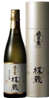
C242-708 飛良泉 純米大吟醸 樫蔵 純米大吟醸 樫蔵720ml