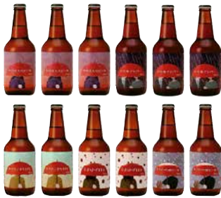
F241-702(SD) 秋田あくらビール あくら12本セット 330mlビール×12(あきたこまちIPL×2、秋田美人の ビール×3、なまはげIPA×2、あきた吟醸ビール×2、 古代米アンバー×3) 〔賞味期限:冷蔵90日〕