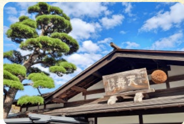
天寿酒造<由利本荘市>