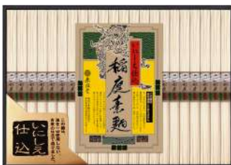
C263-712(NOL-30A)★ 無限堂 稲庭素麺「いにしえ仕込」 稲庭そうめん40g×22