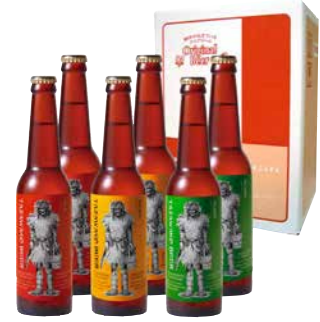
F245-711 田沢湖ビール ワールドベストセレクション アルト、ケルシュ、ピルスナー 各330ml×2