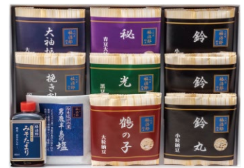
D243-726(NK-4) 二代目福治郎 高級納豆ギフト こまちセット 鶴の子×1、鈴丸×3、光黒×1、秘伝×1、大袖振り×1、ひき わり×1 各30g×2、尻底半島の塩50g×1、みそたまり45ml×1 〔賞味期限:冷蔵12日〕