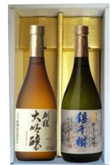
C241-721 刈穂 大吟醸のみくらべ 刈穂大吟醸・純米大吟醸銀千樹 各720ml×1