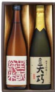
C241-724(SG-40) 太平山 彩月セット 純米大吟醸天巧、生酏秋田純米 各720ml×1