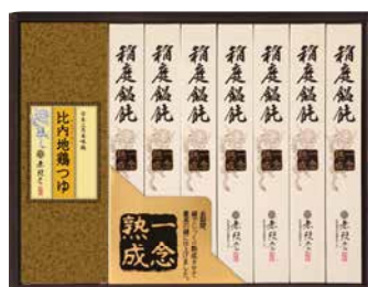
C263-710(OCH-30A) ★ 無限堂 稲庭饅頭「一念熟成」比内地鶏つゆ付 稲庭うどん80g×7、比内地鶏つゆ30ml×7