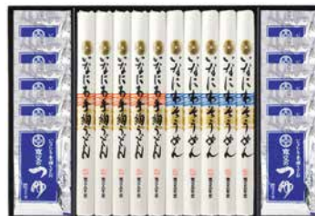
C262-709(TW-50) ★ 寛文五年堂 いなにわ涼味麺・つゆ詰合せ いなにわ手絢うどん80g×5、いなにわそうめん80g×5、 寛文のつゆ(濃縮3倍)30ml×10