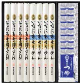
C262-708(TW-40) ★ 寛文五年堂 いなにわ涼味麺・つゆ詰合せ いなにわ手絢うどん80g×4、いなにわそうめん80g×4、 寛文のつゆ(濃縮3倍)30ml×8