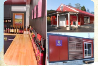
小坂七滝ワイナリー<小坂町>