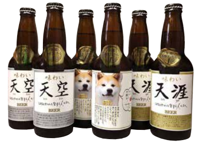
F206-707 湖畔の杜ビール 全国酒類コンクール 第1位選りすぐりビールセット 味わい天空®, 秋田犬BEER®, 味わい天涯® 各330ml×2 〔賞味期限:冷蔵120日〕