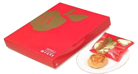
C252-710 かおる堂 秋田県産りんごを使ったパイ 秋田県産りんごを使ったパイ×12個入 〔賞味期限:常温30日〕