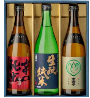
C245-706(TMN-B) 高清水 まごころセット 辛口純米、生酏特別純米酒、酒乃国純米酒 各720ml×1