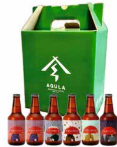
F241-701(SC) 秋田あくらビール 受賞BEER&ギフトセット 330mlビール×6(あきたこまちIPL、秋田美人のビール ×2、あきた吟醸ビール、なまはげIPA、古代米アンバー) 〔賞味期限:冷蔵90日〕