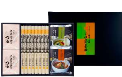
C261-703(GR) 八代目 佐藤養助 稲庭干温饨 つゆ・カレー2種詰合せ うどん80g×8、醤油つゆ(アルミパック入80g×3袋)×2、 グリーンカレー180g×1、レッドカレー180g×1