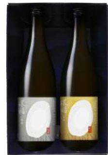
C244-719 爛漫 純米大吟醸 環稻セット 純米大吟醸 百田・一穂積 各720ml×1