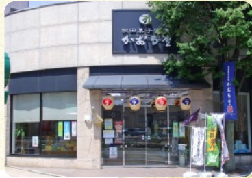
一乃穂本店<秋田市>

※本マップは商品の主な産地・製造地を基準に掲載しており、販売店舗所在地と異なる場合があります。