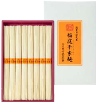
C261-708(IS-30) 八代目 佐藤養助 稲庭干素麺 そうめん80g×8