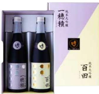
C244-721 秀よし 一穂積・百田セット 純米大吟醸 一穂積・百田 各720ml×1