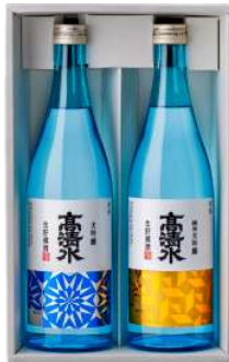
C244-731 高清水 涼風セット 大吟醸生貯蔵酒、純米吟醸生貯蔵酒 各720ml×1