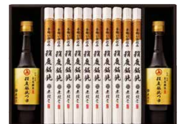
C263-719(MA-50B) ★ 無限堂 稲庭饅頭 安藤醸造の稲庭饅頭つゆ詰合せ 稲庭うどん90g×10、安藤醸造稲庭うどんつゆ360ml×2