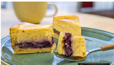
F252-703(CC6-A、B、P) やをら 米粉と糀のチーズケーキ6個入 チーズケーキ×6個(発酵あずき、ブルーベリー、桃 各2) 〔賞味期限:冷凍30日 解凍後冷蔵3日〕