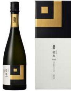
C242-702 高清水 大吟醸 瑞兆720ml 大吟醸瑞兆720ml