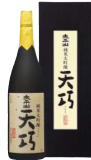
C241-726(天巧) 太平山 純米大吟醸 天巧1.8ℓ 純米大吟醸1.8ℓ