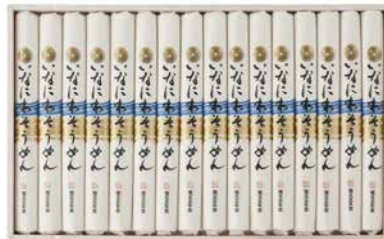
C262-706(SAK-50N) ★ 寛文五年堂 いなにわそうめん いなにわそうめん80g×16