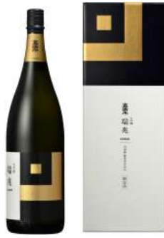
C242-701 高清水 大吟醸 瑞兆1.8ℓ 大吟醸瑞兆1.8ℓ