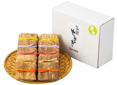
F243-727(509103) 安藤醸造 角館ちまき全種詰合せセット ちまき5種各2個入(桃豚チャーシュー、比内地鶏と枝豆、 山菜、きのこ、秋田牛すきやき) 〔賞味期限:冷凍90日〕