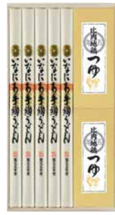
C262-703(RZ-30) ★ 寛文五年堂 いなにわ手絢うどん・比内地鶏つゆ詰合せ いなにわ手絢うどん100g×5、比内地鶏つゆ120ml×2