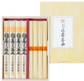
C261-710(US-30) 八代目 佐藤養助 稲庭干温饨・稲庭干素麺 うどん80g×4、そうめん80g×4