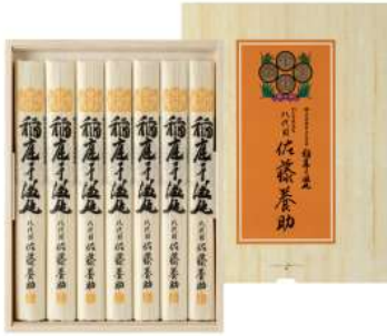
C261-713(MYS30)★ 八代目 佐藤養助 稲庭干温饨 うどん80g×7