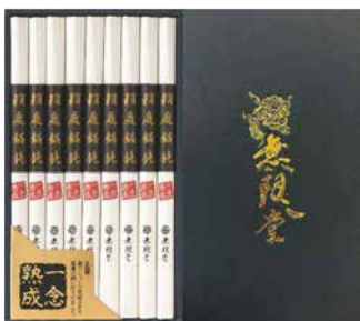
C263-708(OM-30A) ★ 無限堂 稲庭饅頭「一念熟成」 稲庭うどん80g×9