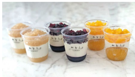
F252-704(PJ6-O、B、P) やをら 雪国ぷりんフルーツジュレ6個入 雪国ぷりんフルーツジュレ(オレンジ、ブルーベリー、桃 各2) 〔賞味期限:冷蔵5日〕