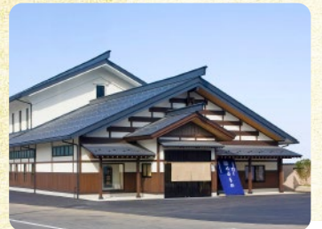
佐藤養助総本店<湯沢市>