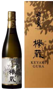
C242-710 飛良泉 純米大吟醸 樫蔵720ml 純米大吟醸 樫蔵720ml