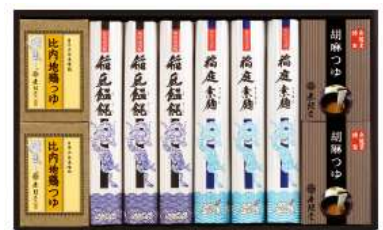
C263-718(USG-50A)★ 無限堂 稲庭饅饨・素麺・つゆ詰合せ 稲庭うどん160g×3、稲庭そうめん160g×3、比内地鶏 つゆ30ml×6、ごまつゆ30g×6