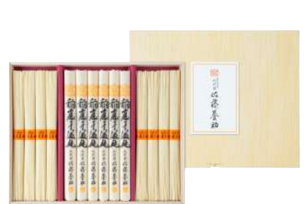
C261-711(US-50) 八代目 佐藤養助 稲庭干温饨・稲庭干素麺 うどん80g×6、そうめん80g×8