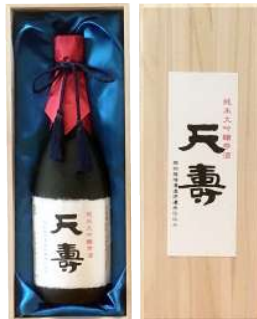
C242-712 天寿 純米大吟醸 零酒 純米大吟醸 零酒720ml