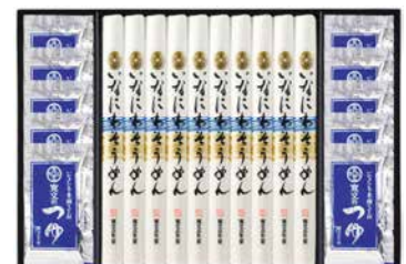
C262-712(TS-50) 寛文五年堂 いなにわそうめん・つゆ詰合せ いなにわそうめん80g×10、寛文のつゆ(濃縮3倍)30ml×10