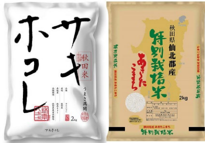
C244-708 秋田米2種(2kg×2) 特別栽培米あきたこまち、サキホコレ 各2kg 〔賞味期限:常温45日〕