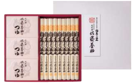
C261-702(WY50N) 八代目 佐藤養助 稲庭干温饨詰合せ うどん80g×9、醤油つゆ(アルミパック入80g×3袋)×3