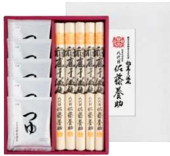
C261-701(WY30N) 八代目 佐藤養助 稲庭干温饨詰合せ うどん80g×5、醤油つゆ(アルミパック入80g×5袋)