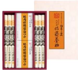
C261-706(HY-30) 八代目 佐藤養助 稲庭干温饨 比内地鶏醤油つゆ詰合せ うどん80g×6、比内地鶏醤油つゆ(アルミパック入40g ×3袋)×2