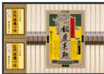
C263-714(NOH-30B)★ 無限堂 稲庭素麺「いにしえ仕込」比内地鶏つゆ付 稲庭そうめん40g×17、比内地鶏つゆ30ml×8