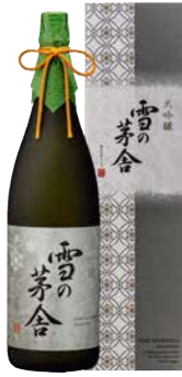
C241-711(G-45) 雪の茅舎 大吟醸 大吟醸1.8ℓ