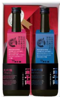
C244-724 一滴千両 大吟醸のみくらべ 一滴千両 大吟醸・純米大吟醸 各720ml×1