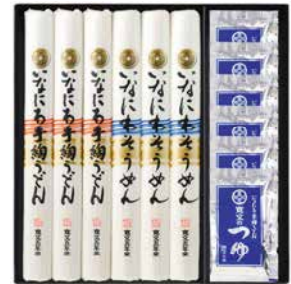
C262-707(TW-30) ★ 寛文五年堂 いなにわ涼味麺・つゆ詰合せ いなにわ手絢うどん80g×3、いなにわそうめん80g×3、 寛文のつゆ(濃縮3倍)30ml×6