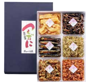
C245-702(M40) 安田のつくだ煮 詰合わせ いかあられ50g、わかさぎ50g、胡桃フィッシュ50g、 ちりめん50g、こえび50g、子持ちわかさぎ50g 各1 〔賞味期限:常温60日〕