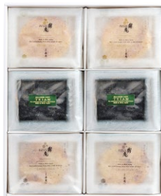
C221-708 米菓匠 金の鼎庵・銀の鼎庵・ 鼎庵の海苔煎餅詰め合わせギフト 金の鼎庵、銀の鼎庵、鼎庵の海苔煎餅 各10枚入 〔賞味期限:常温150日〕