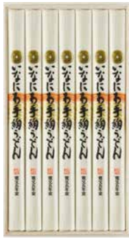
C262-701(UTR-30) ★ 寛文五年堂 いなにわ手絢うどん いなにわ手絢うどん100g×7