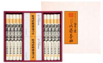
C261-707(HY-50) 八代目 佐藤養助 稲庭干温饨 比内地鶏醤油つゆ詰合せ うどん80g×10、比内地鶏醤油つゆ(アルミパック入40g ×5袋)×2