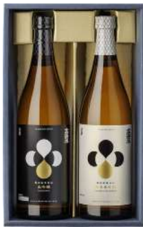
C244-730(TJD-B) 高清水 純米大吟醸・大吟醸720mlセット 純米大吟醸、大吟醸 各720ml×1