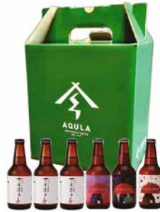
F241-703(SSBI) 秋田あくらビール サキホコレビールセット 330mlビール×6(サキホコレBrutIPA×3、なまはげIPA、 秋田美人のビール、古代米アンバー) 〔賞味期限:冷蔵90日〕